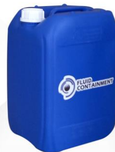
FOTOGRAFÍA USADA COMO REFERENCIA