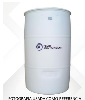
FOTOGRAFÍA USADA COMO REFERENCIA