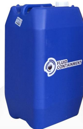
FOTOGRAFÍA USADA COMO REFERENCIA