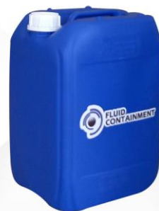
FOTOGRAFÍA USADA COMO REFERENCIA